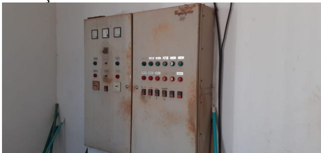
Descrição: Central de comando