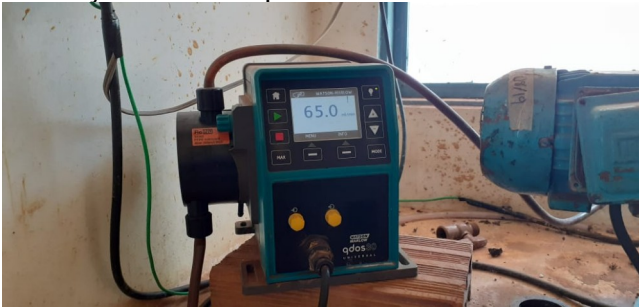
Descrição: Dosador de cloro