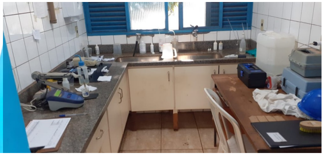
Autor: AMAE/Rio Verde Descrição: Laboratório físico/químico