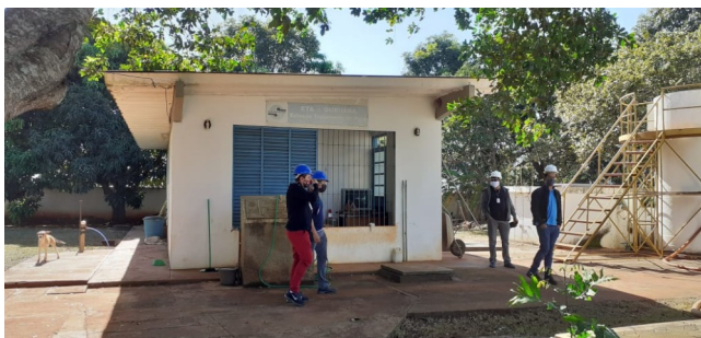
Autor: AMAE/Rio Verde Descrição: ETA Ouroana