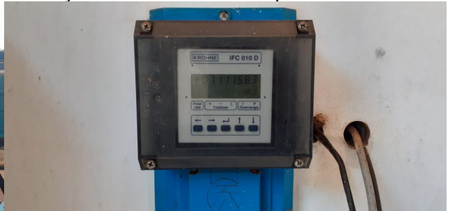
Descrição: Medidor de fluxo