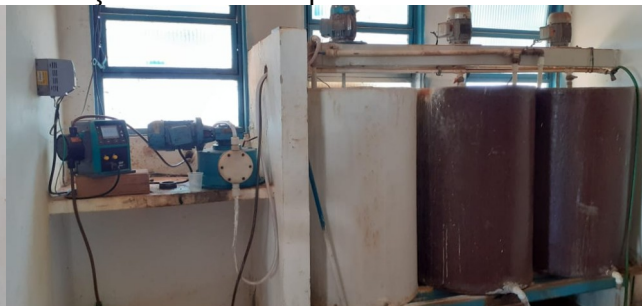
Descrição: Casa de química