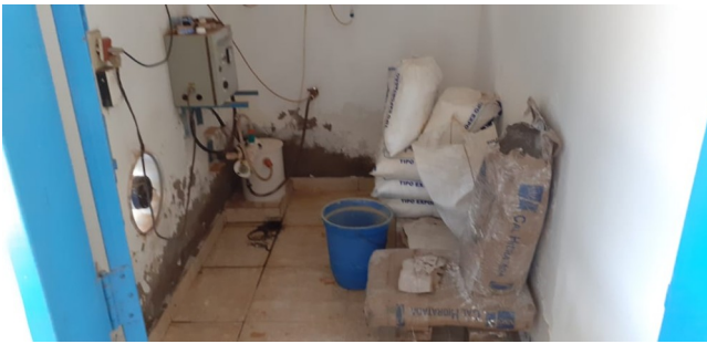
Autor: AMAE/Rio Verde Descrição: Casa de química. Necessita melhorias