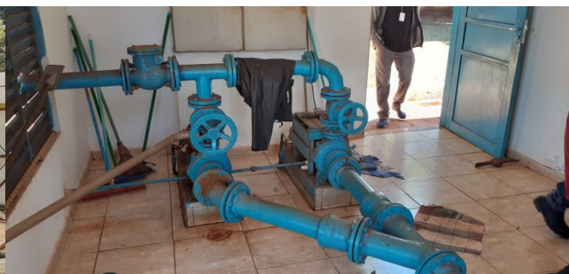
Descrição: Casa de máquinas